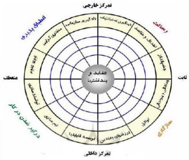
شکل (۱): ابعاد فرهنگ سازمانی منبع: (Denison, 2000) به نقل از ابراهیم پور و همکاران، ۲۰۱۱