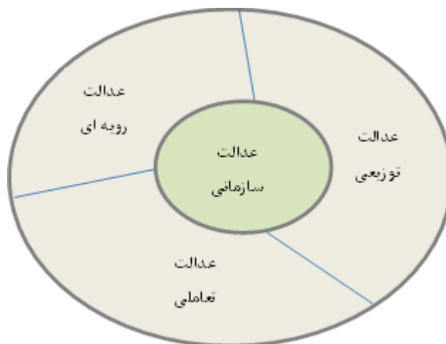
شکل (۲): ابعاد عدالت سازمانی